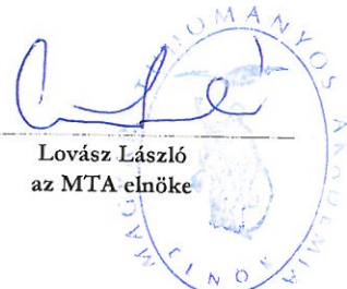
Lovász László az MTA elnöke

Az intézmény 2019. évi költségvetését jóváhagyom: