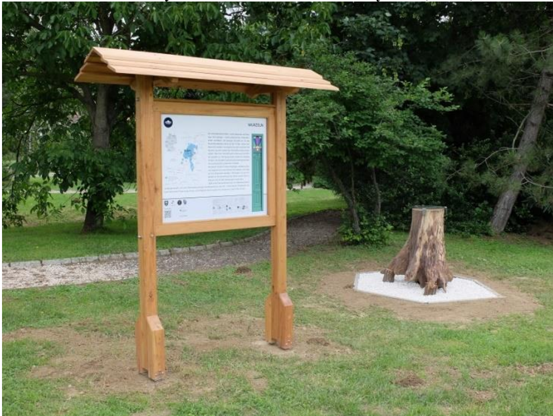
6. kép Wurzeln – Gyökerek állomás: installáció (Feked)