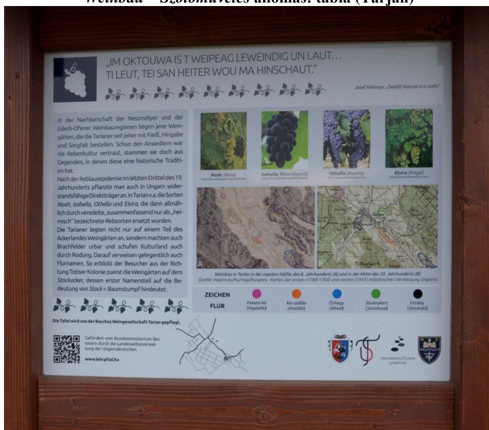
8. kép Weinbau – Szőlőművelés állomás: installáció (Tarján)