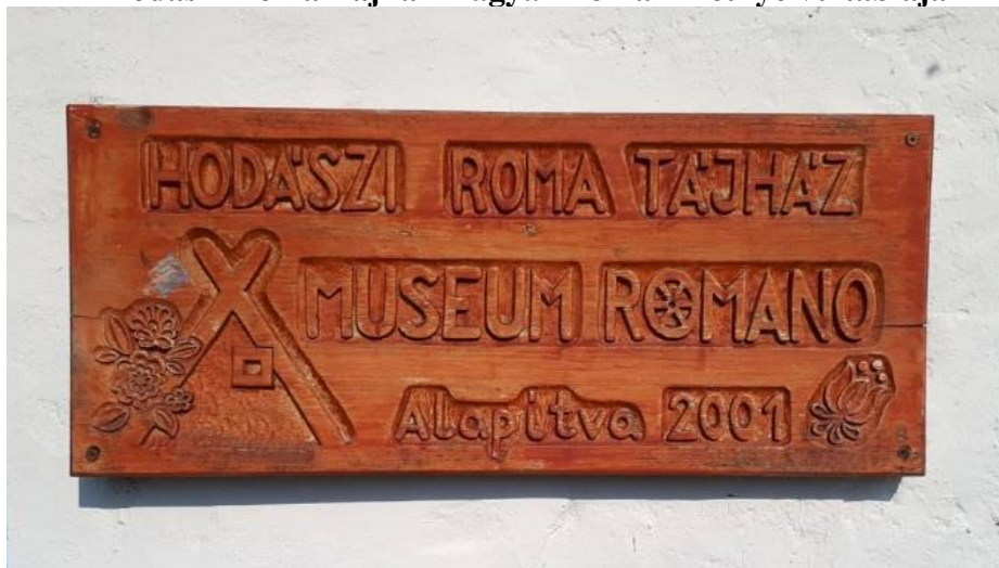
A Hodászi Roma Tájház magyar–romani kétnyelvű táblája