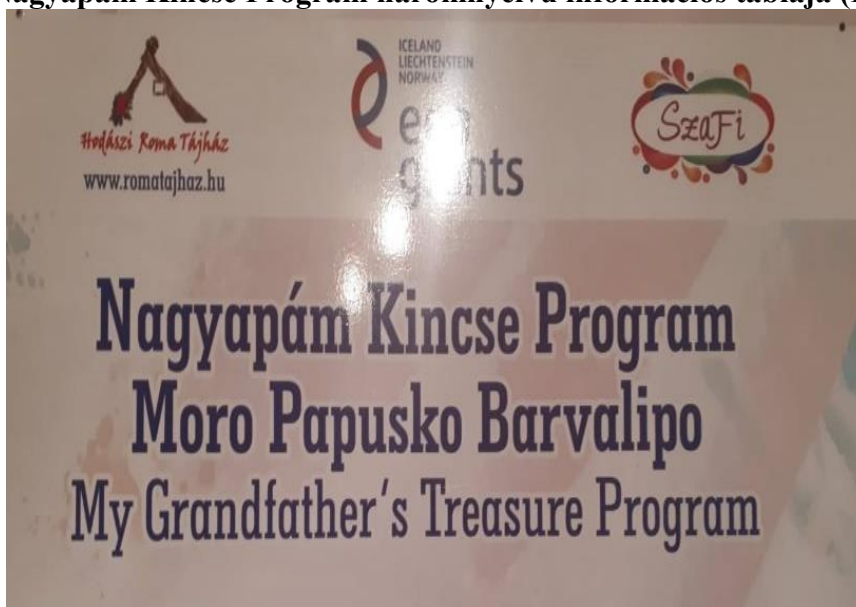
A Nagypám Kincse Program háromnyelvű információs táblája (Hodász)