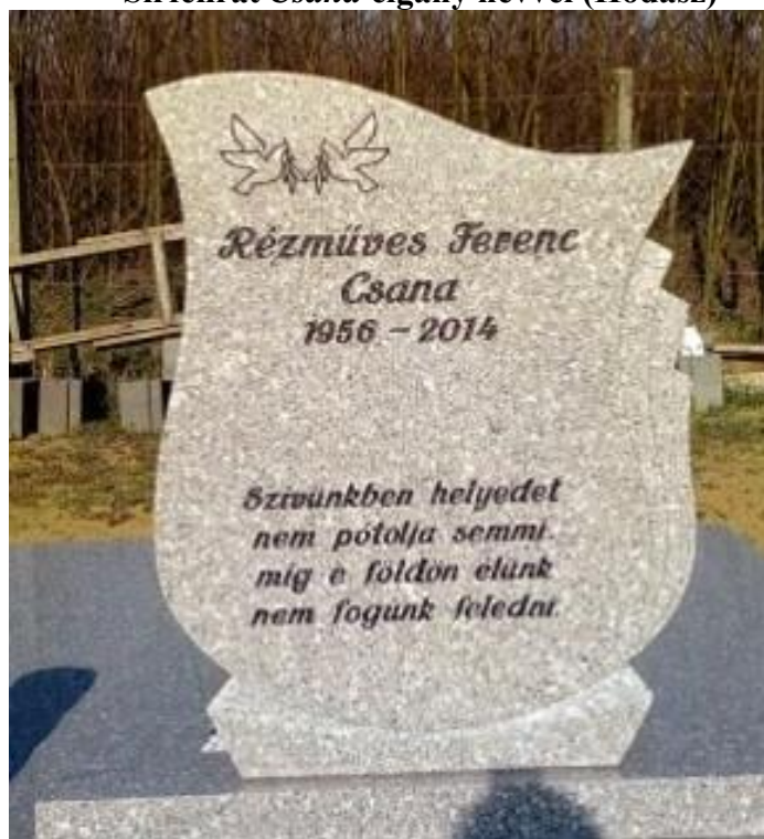
Sírfelirat Csana cigány névvel (Hodász)