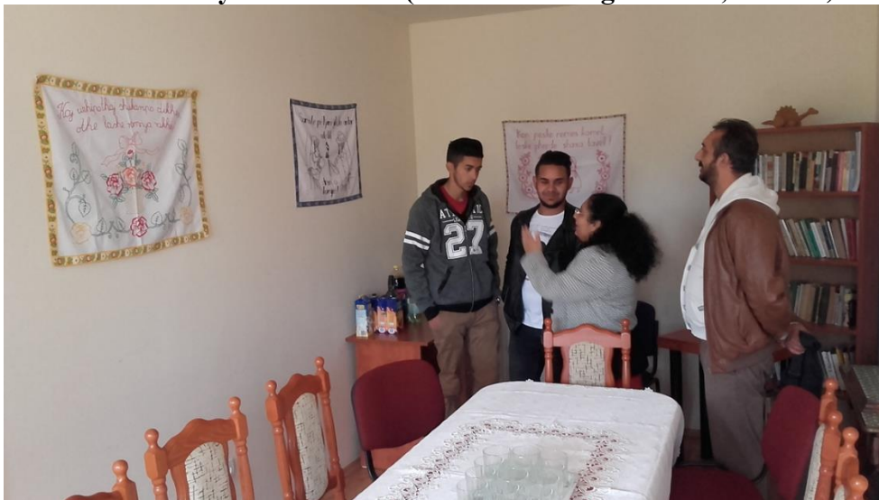
Romani nyelvű falvédők (Menta Közösségi Teaház, Hodász)