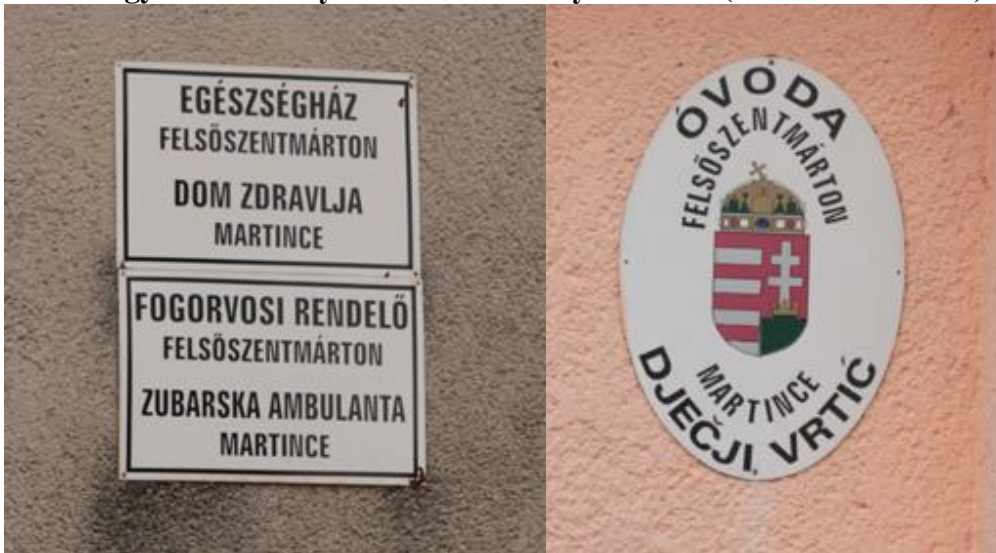
Magyar–horvát nyelvű közintézmény feliratok (Felsőszentmárton)